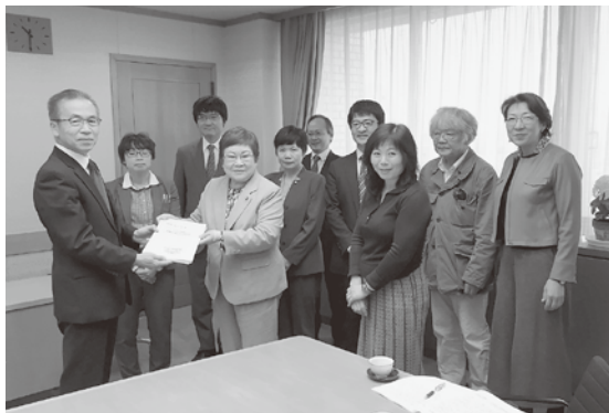
市長に要望書を渡す、淀地区委員長と市議団

を軽減すること、老朽化した校舎の改修、保育園の増設、生活道路の改善、介護制度の充実など、市民要望の実現に予算をふりむけることを求めました。 市長は、「やり方は異なるがよりよい市政にしたいという思いは同じ。よく見させてください」と答えました。 アンケートに寄せられた要望の実現にとりくんでいきます。